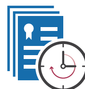
DEPOSITAR (‘BANK’) PERMISOS

Un SCE proporciona un alto grado de flexibilidad a las compañías para que puedan decidir la mejor manera de cumplir con sus obligaciones. Las compañías pueden reducir sus propias emisiones y/o comprar permisos sobrantes de otras compañías. Los gobiernos típicamente permiten a las empresas depositar permisos para ser usados en una fecha posterior (‘banking’). En muchos sistemas, también pueden hacer uso de créditos de compensación (‘offset credits’) nacionales o internacionales provenientes de proyectos de reducción de emisiones en sectores no regulados por el SCE. Estas decisiones individuales implican la minimización de los costos de mantenerse debajo del tope de emisiones del SCE, no sólo para las compañías, sino para la sociedad en su conjunto.