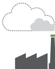
REDUCIR SUS EMISIONES